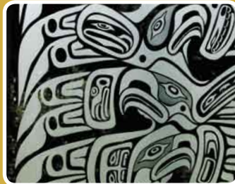
↑ KREISLAUF Andreas Weiderer INDIANISCHES TRIPTYCHON Josef Hilgart ↑