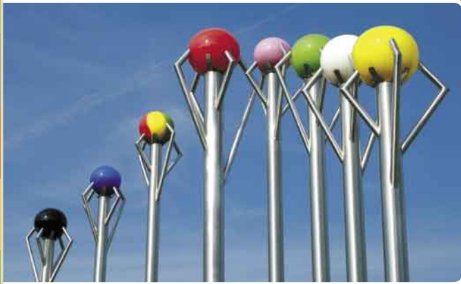
↓ REGENBOGEN Oswald Faber